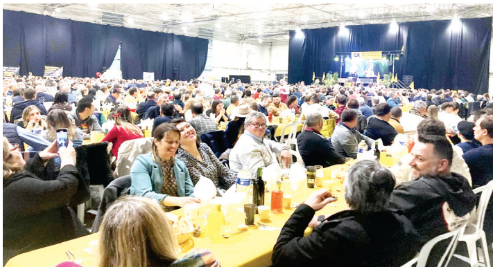
Repas de l'Assemblée Générale 2025 à Agen

Après des années de ténèbres. Le peuple CR a grandi, migré, conquis de nouveaux territoires.