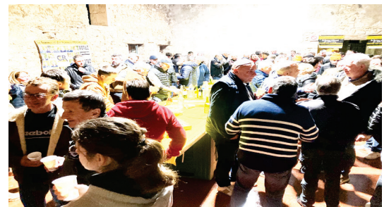
Apéro en campagne à Bruch, janvier 2025

Mercredi 7 mai à la salle des fêtes du Temple-sur-Lot