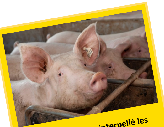
La CR Bretagne a interpellé les députés et sénateurs sur la crise porcine