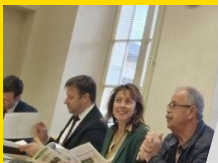
Rencontre avec Carole Delga, présidente de Régions de France