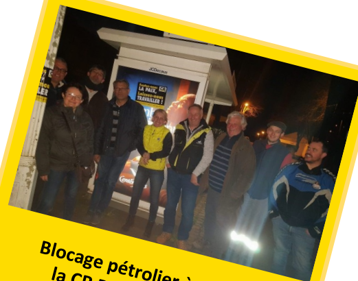
Blocage pétrolier à Lorient, la CR Bretagne y était !