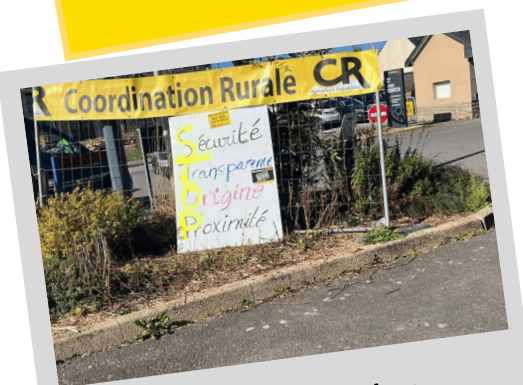
« Mangez breton ! » : la CR Bretagne sensibilise le grand public