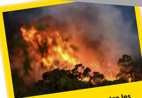
La CR 29 s'insurge contre les propos d'un élu municipal de La