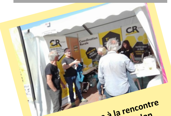
La CR Bretagne à la rencontre des agriculteurs au salon « La Terre est notre Métier »