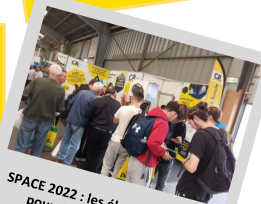
SPACE 2022 : les élus CR mobilisés pour défendre les intérêts de tous les agriculteurs