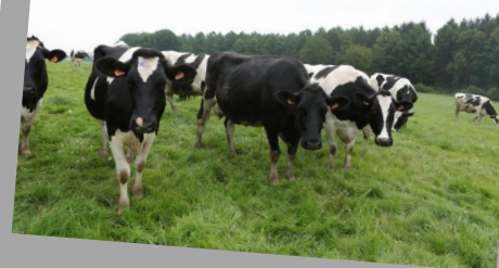
Victoire juridique concernant la rétention des ASDA pour les bovins contre le GDS