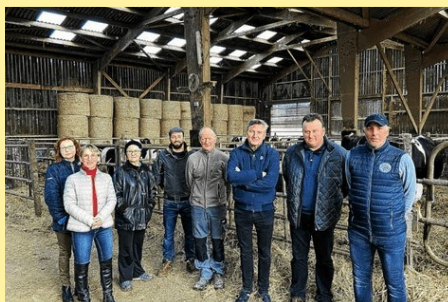
La CR 29 rencontre le député Didier Le Gac