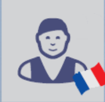
Intermédiaire (opérateur responsable de l'envoi, RDE)