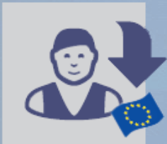
Importateur de marchandises britanniques