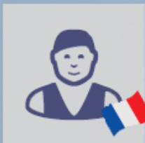
Intermédiaire (opérateur responsable de l'envoi, RDE)